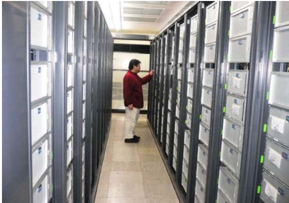
図 2: TSUBAME の一部

ューニングを行ったうえで、10月を目処に、一部のテストノードを除いてほぼ全ノードを学内全体、および学外との共同利用に公開する予定である。